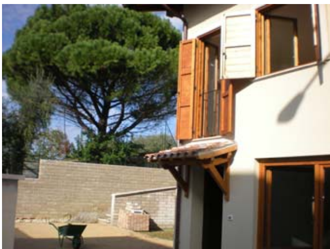
Esterno ingresso fase completamento