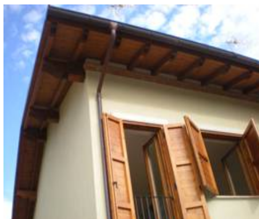
esterni con tetto in legno