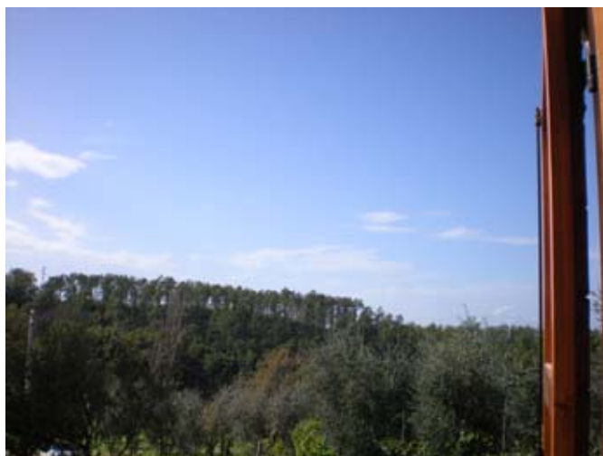
Panorama veduta finestra